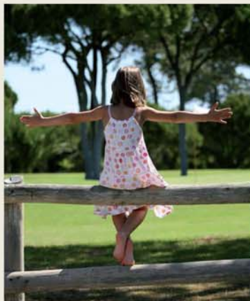
Manicured Gardens Jardins