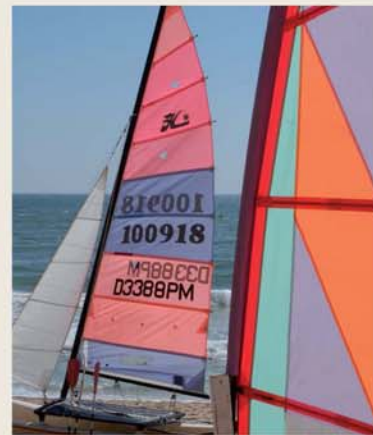
Watersports Desportos Nauticos

Ser proprietário de uma Villa no Pine Cliffs é poder usufruir de todas as infra-estruturas do resort, geridas pelo Grupo Starwood Hotels & Resorts, através da marca The Luxury Collection, beneficiando ainda da maior privacidade e exclusividade que uma moradia pode oferecer.