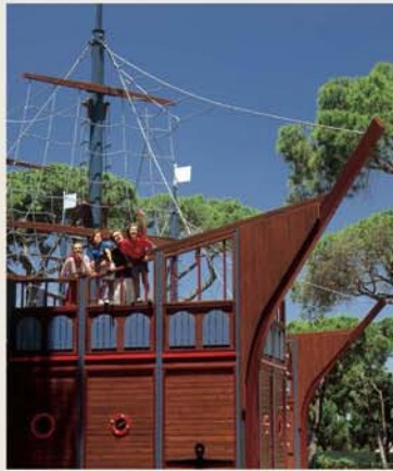
Porto Pirata Children's Village Aldeia das Crianças