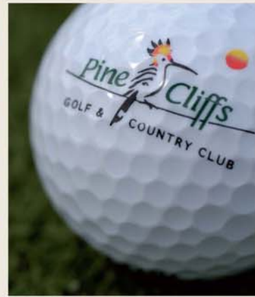
9 Hole Golf Course Campo de Golfe