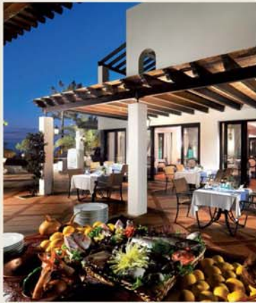
12 Restaurants and Bars Restaurantes e Bares

Besides being able to enjoy all of the resort's facilities, managed by Starwood Hotels & Resorts, through its The Luxury Collection brand, owners of a luxury Villa at Pine Cliffs benefit from living in the privacy of a luxurious environment.