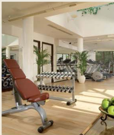
Gym and Health Club Ginásio e Health Club